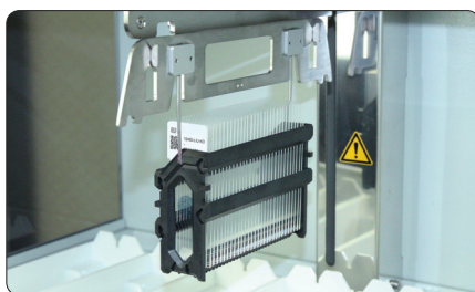
Загрузка до 30 слайдов в штатив