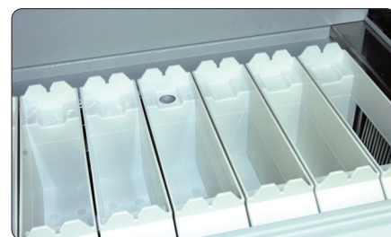
До 18 доступных емкостей для реагентов